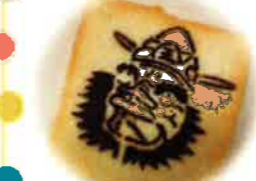
じごくのそうべえクッキー