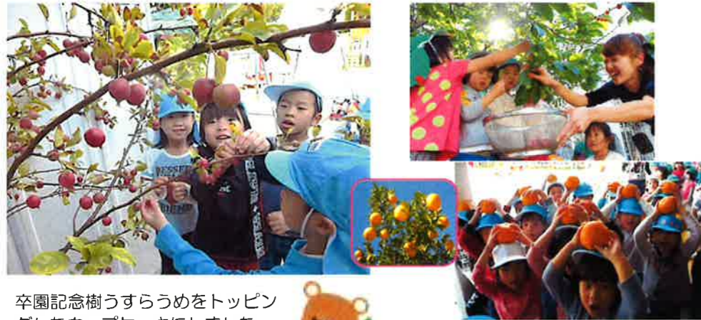
卒園記念樹うすらうめをトッピングしたカップケーキにしました。

園庭には卒園記念樹として植えられた実のなる木がたくさんあります。季節ごとに収穫の喜びを味わいおやつに食べています。