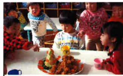
クリスマスツリーオーダブル