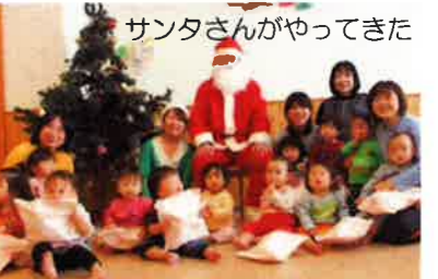
サンタさんがやってきた