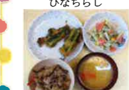
リクエストメニュー