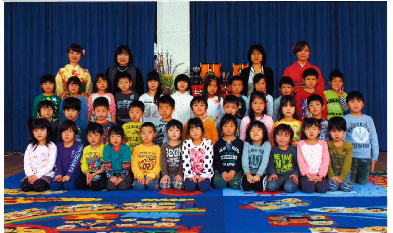
「カメラのファインダーを通じて見える子どもの笑顔」