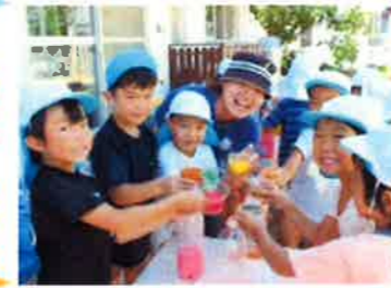
保育園ならではの夏のあそびを楽しみました。