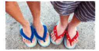
子どもたち愛用のミサトっ子草履

大阪では一番高い山“金剛山”に登りました。子どもたちの声がやまびことなって響きました。登り坂が険しかったですが、みんなで声をかけながら自分の力で登りました。