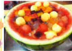
スイカのフルーツポンチ