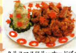
クリスマスツリーオーダブル